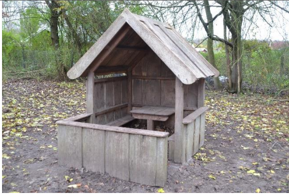
Redskab: Legehus Årgang: Producent: Er redskabet mærket: Nej Er der registreret fejl/mangler: Ja