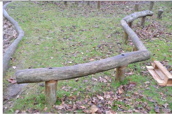
Redskab: Balancebom Årgang: 2001 Producent: Aktiv Leg Er redskabet mærket: Ja Er der registreret fejl/mangler: Nej