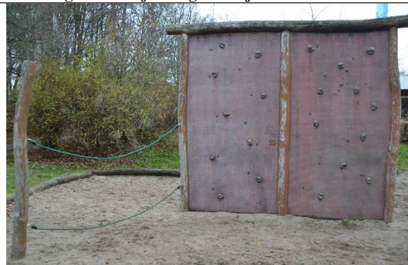
Redskab: Klatrevæg Årgang: 2001 Producent: Aktiv Leg Er redskabet mærket: Ja Er der registreret fejl/mangler: Ja