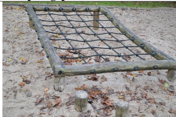
Redskab: Klatrenet Årgang: Producent: Leika Er redskabet mærket: Ja Er der registreret fejl/mangler: Ja