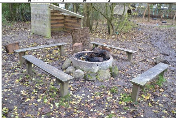
Redskab: Bålsted Ikke omfattet af DS/EN 1176