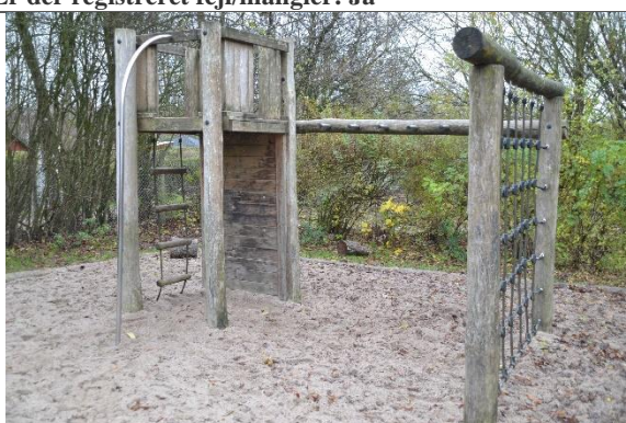
Redskab: Klatrestativ Årgang: Producent: Leika Er redskabet mærket: Nej Er der registreret fejl/mangler: Nej