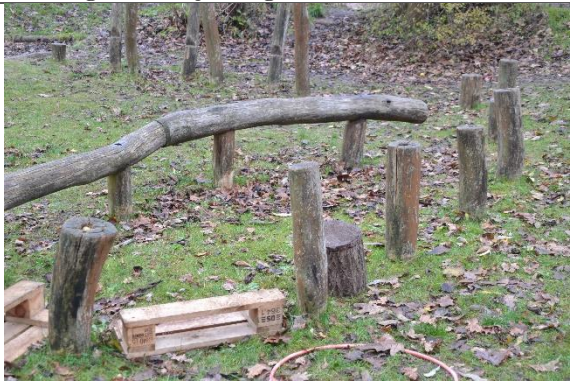
Redskab: Balancestolper Årgang: 2001 Producent: Aktiv Leg Er redskabet mærket: Ja Er der registreret fejl/mangler: Ja