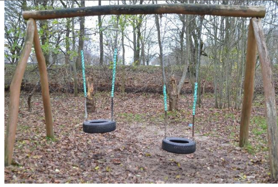
Redskab: Gyngestativ Årgang: Producent: Er redskabet mærket: Ja Er der registreret fejl/mangler: Ja