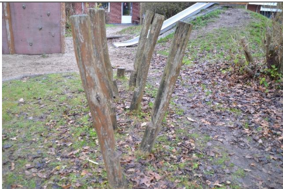
Redskab: Stylder Årgang: 2001 Producent: Aktiv Leg Er redskabet mærket: Ja Er der registreret fejl/mangler: Nej