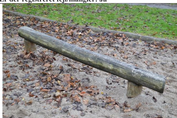
Redskab: Balancebom Årgang: Producent: Leika Er redskabet mærket: Nej Er der registreret fejl/mangler: Ja