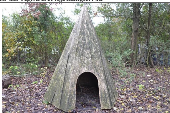
Redskab: Legehus Årgang: Producent: Er redskabet mærket: Nej Er der registreret fejl/mangler: Nej